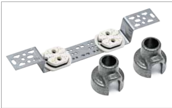
Unterputzmontage mit LEIFELD Schalltrenner und Iso-Kappe