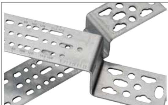
Mit beidseitig eingepägten Stichmaßabständen