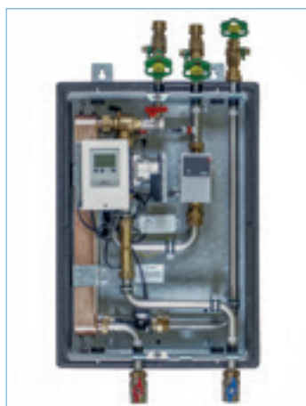
FW-EZ 40 Best-Nr. 1610003