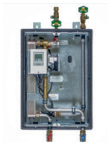
FW-E 40 Best-Nr. 1610001